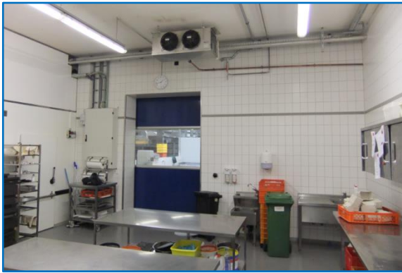
Arbeitsraum-Klimatisierung „Kalte Konditorei“ Raumtemperatur +12 / +25°C

Links: Munz Zellenfront mit TK-, SK-, NK-Räumen