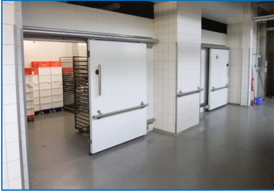
Zellenfront Kombinationsanlage mit 2 Stück manuellen Kühlraum-Schiebetüren