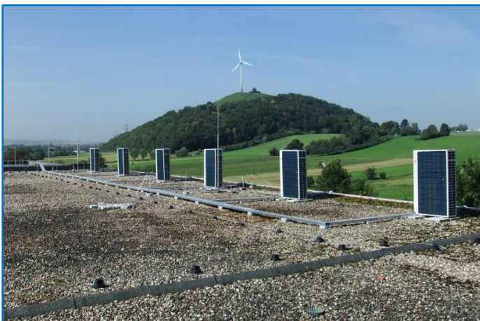
Außengeräte auf Dach über dem Palettenlager

Baujahr 2013 Anlagen Klimatisierung/Heizung eines Palettenlagers von 1000m 2 bei einer Höhe von 8,5m mit 6 kombinierten Hocheffizienz-Klima/Wärmepumpen und Luftverteilschläuchen Temp.-Bereich +18°C bis +25°C Kältetechnik Kälteleistung variabel je Gerät bis max. 28.000 Watt = Gesamt 168.000 Watt Heizleistung variabel je Gerät bis max. 31.500 Watt = Gesamt 189.000 Watt Sonstiges pro Gang unabhängige Temperatur-Einstellung, zentrale Bedienung über PC-Software, Anschluss an Fernüberwachung