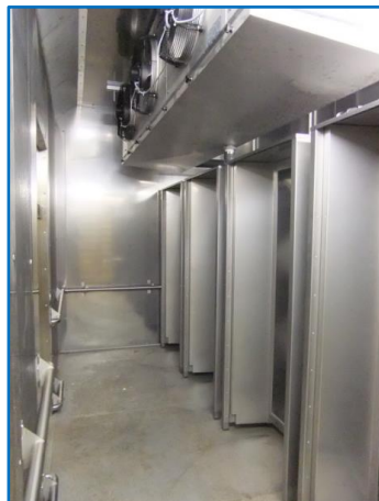
Gusto-Chiller mit 4 Schockstationen