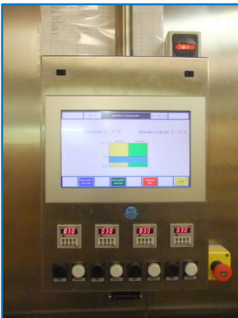
Munz Cooltouch CT2

Steuerungen Munz Cooltouch CT2 , pro Schockstation eine separate Schockuhr